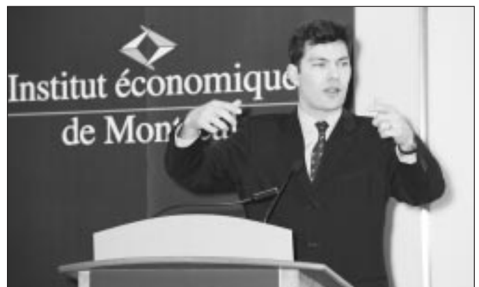
Mario Dumont, chef de l'Action démocratique du Québec, s'adresse à l'auditoire de l'IEDM.

Six conférences majeures ont été organisées par l'Institut en 2003. Au total, nous avons accueilli plus d'un millier de participants à ces événements publics, soit le double de l'année précédente. Il ne faut pas oublier non plus que nos collaborateurs internes ou associés ont participé à une douzaine d'autres activités, qui vont de la présentation de mémoires lors d'audiences publiques à des débats et discours devant des auditoires plus spécifiques. Environ 700 autres personnes, surtout des décideurs, ont assisté à ces événements. Des milliers d'autres en ont reçu l'écho à travers la couverture médiatique qui en a résulté.