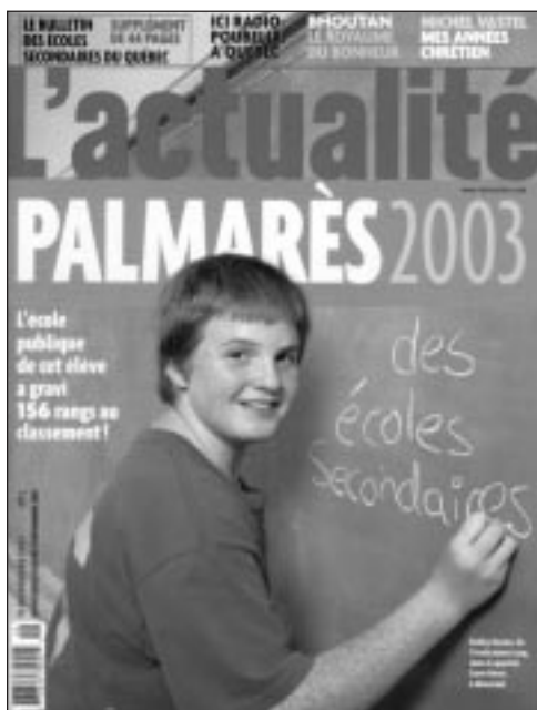
Le numéro de novembre 2003 du magazine L'actualité consacré au Bulletin des écoles secondaire du Québec .

Le Bulletin des écoles secondaire du Québec , l'étude la plus connue de l'IEDM qui rejoint chaque année un million de lecteur dans le numéro spécial du magazine L'actualité qui lui est consacrée, paraissait pour la quatrième année consécutive à l'automne 2003. Comme chaque année, divers groupes d'intérêt qui s'opposent à la liberté de choix des parents dans l'éducation de leurs enfants ont tenté, sans succès, de discréditer le Bulletin . La preuve de son utilité est toutefois la réaction enthousiaste des centaines de milliers de parents qui s'en servent comme outil d'information. Cette année, nous avons fait un effort spécial pour rejoindre les médias de l'extérieur de Montréal, ce qui a valu une augmentation de 25 % du nombre de reportages consacrés au Bulletin .